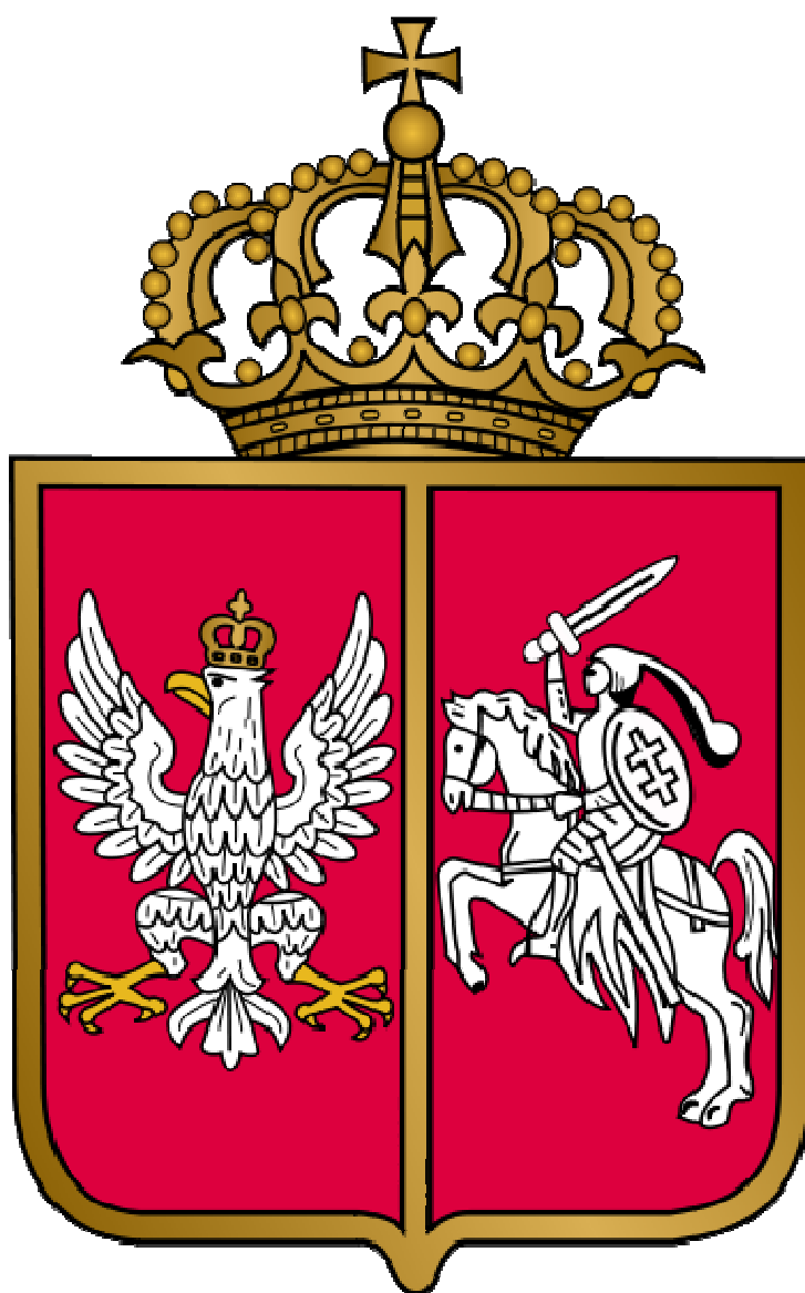
Herb Królestwa Polskiego 1830 r.

Powstanie listopadowe, wojna polsko-rosyjska 1830-1831 – polskie powstanie narodowe przeciw Rosji, które wybuchło w nocy z 29 na 30 listopada 1830 roku, a zakończyło się 21 października 1831 roku Zasięgiem swoim objęło Królestwo Polskie i oraz Litwę, Żmudź i Wołyń. W rocznicę wybuchu powstania obchodzony jest Dzień Podchorążego.