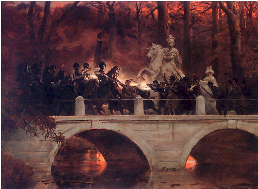
Starcie belwederczyków z kirasjerami rosyjskimi na moście w Łazienkach 29 listopada 1830 Obraz Wojciecha Kossaka

Sygnalem do wybuchu powstania miał być pożar browaru na Solcu i kamienicy przy ul. Dzikiej. Powstanie wybuchło wieczorem ok. godz. 18:00 29 listopada 1830 roku, gdy podporucznik Piotr Wysocki wszedł do Szkoły Podchorążych Piechoty w Łazienkach, przerwał zajęcia z taktyki – wygłosił mowę: „ Polacy! Wybiła godzina zemsty. Dziś umrzeć lub zwyciężyć potrzeba! Idźmy, a piersi wasze niech będą Termopilami dla wrogów ” wyprowadzając podchorążych na miejsce zbiórki – pod pomnik króla Jana III Sobieskiego.