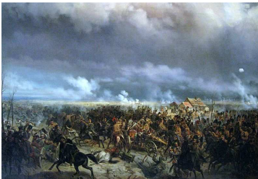
Bitwa pod Grochowem 1831

Po początkowych odosobnionych sukcesach polskich w bitwach pod Stoczkiem 14 lutego i Wawrem, doszło do rosyjskiej próby szturmu na Warszawę. Jednak nierozstrzygnięta bitwa o Olszynkę Grochowską 25 lutego 1831 roku, podczas której ciężko ranny został Chłopicki, uniemożliwiła te plany i przyniosła stronie polskiej sukces taktyczny.