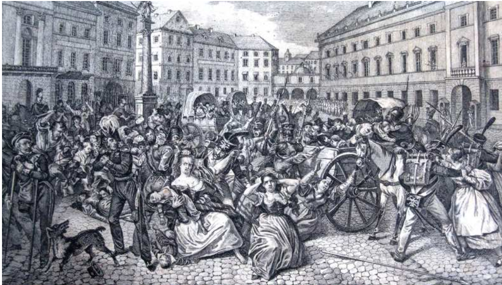
Porwanie dzieci polskich na Placu Zamkowym w Warszawie

30 listopada Rada Administracyjna powołała Straż Bezpieczeństwa dowodzoną przez Piotra Łubieńskiego, której zadaniem było rozbrojenie zrewoltowanej ludności cywilnej Warszawy. Broń odbierano powstańcom, zakazano też używania rewolucyjnych kokard granatowo – biało – czerwonych, wprowadzając w ich miejsce białe.