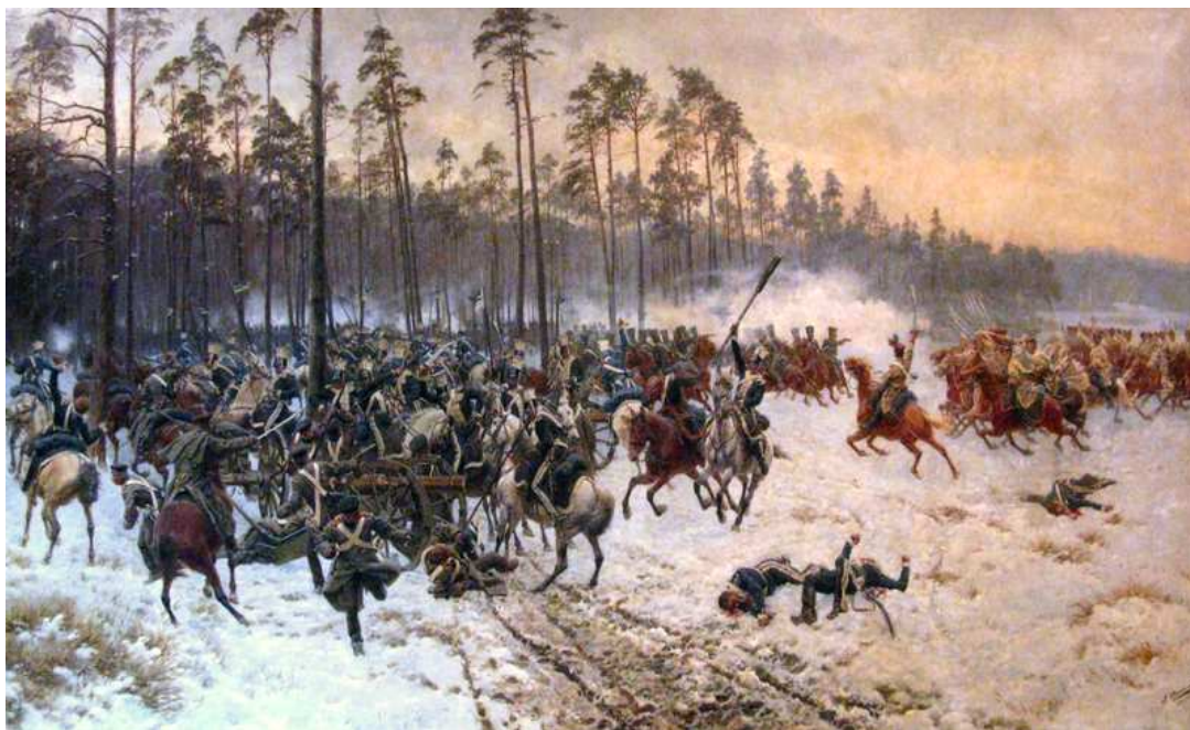
Bitwa pod Stoczkiem 1831

Po początkowych odosobnionych sukcesach polskich w bitwach pod Stoczkiem 14 lutego i Wawrem, doszło do rosyjskiej próby szturmu na Warszawę. Jednak nierozstrzygnięta bitwa o Olszynkę Grochowską 25 lutego 1831 roku, podczas której ciężko ranny został Chłopicki, uniemożliwiła te plany i przyniosła stronie polskiej sukces taktyczny.